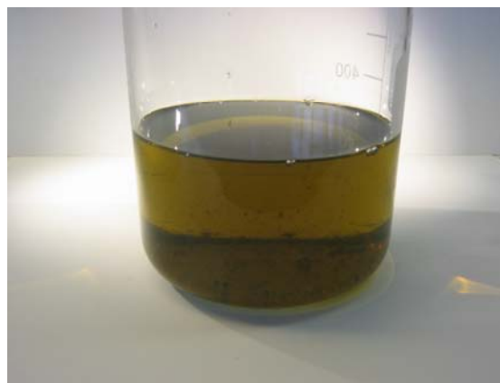
Klar prøve, men med partikler