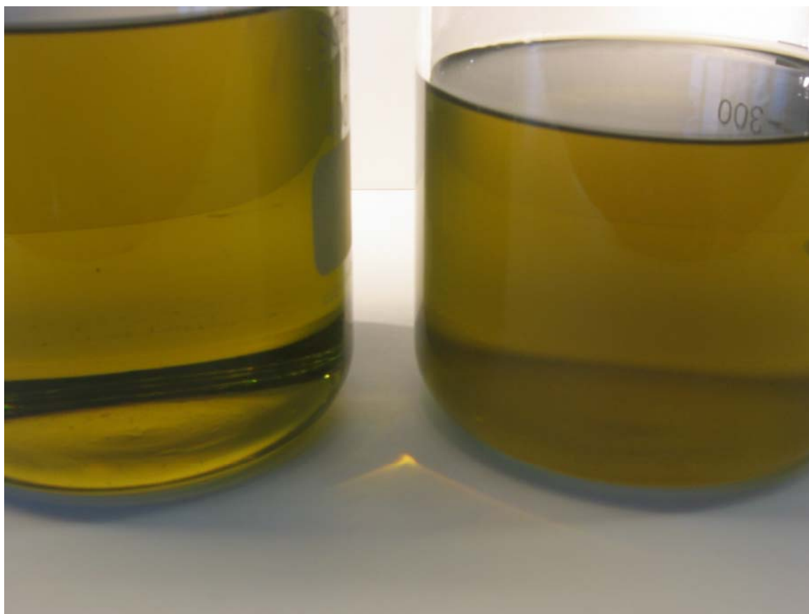
Ren og klar prøve