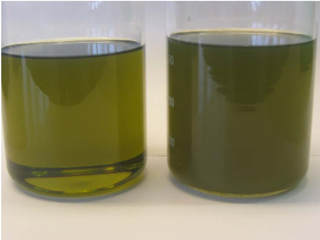
Ren og klar prøve