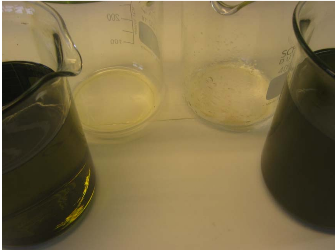
Klar og ren prøve og tilhørende prøveglass