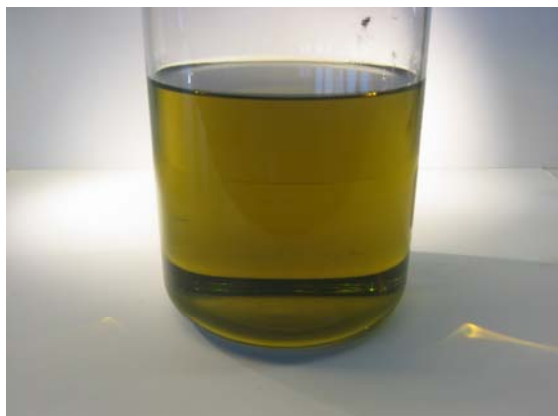
Ren og klar prøve "Clear & Bright"