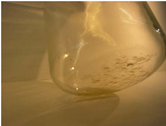
Fritt vann som perler i bunnen av prøveglasset